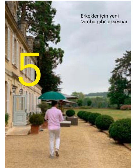
Erkekler için yeni 'zımba gibi' aksesuar