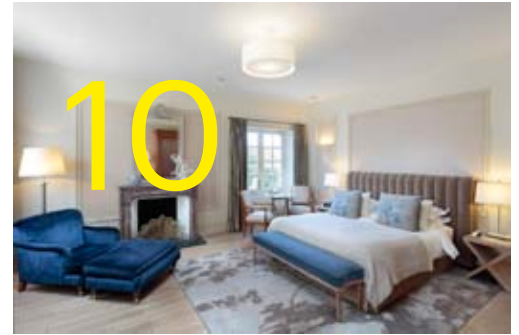
Erkekler için yeni 'zimba gibi' aksesuar

havuzu ve biri Michelin yıldızlı, diğeri bir seranın içinde bulunan iki restoran var. Her odası farklı tasarlanmış olan şato sene boyunca düzenlenen organizasyonlarına da ev sahipliği yapıyor. Le Botaniste restoranı Michelin listesinde. Alakart menü dışında tadım menüsü de bulunuyor. Diğer restoranı Le Petit Jardin daha lokal bir mutfağa sahip. Kendi seralarında bölgeye özgü yetişen sebze ve meyvelerle menülerini hazırlıyorlar. Havuz kenarındaki bu cam restoranı deneyin derim.